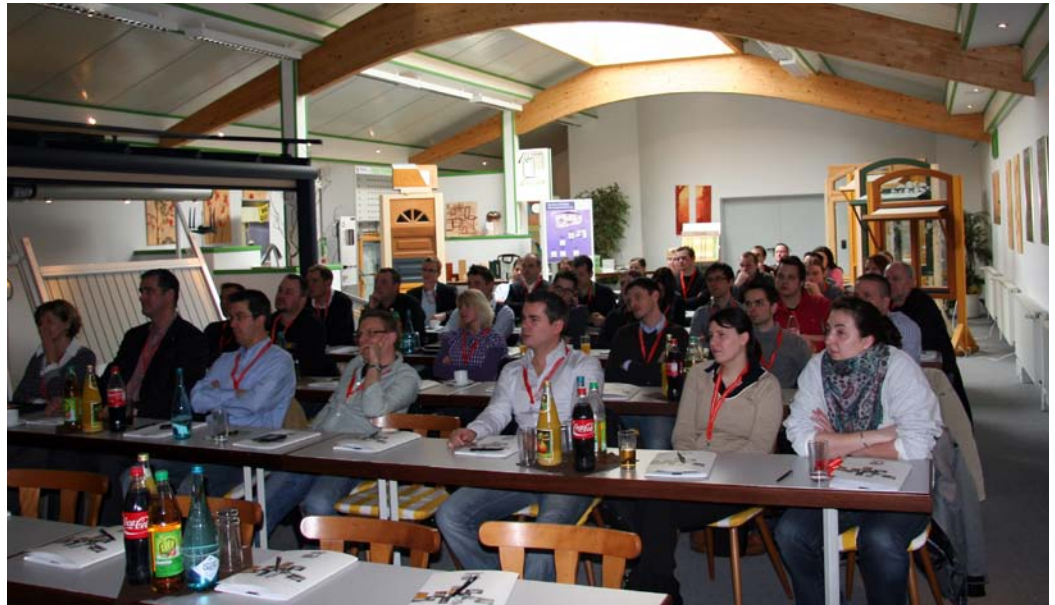
Volles Haus bei Lucas: Zeit für Wissensvermittlung, Netzwerken und Spaß

Am Abend stand eine Besichtigung des Berentzen Hofes auf dem Programm. Nach einem Rundgang durch das Brennereimuseum konnten sich